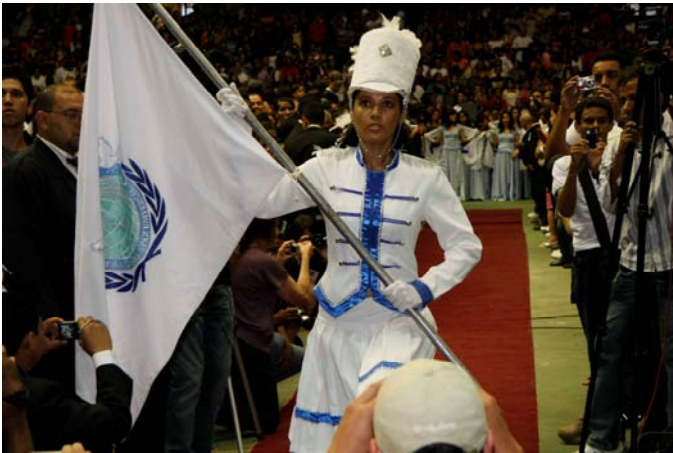
Entradas das Bandeiras