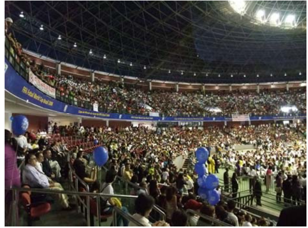
Mais de 20 mil convidados lotaram o Ginásio Nilson Nelson em Brasília