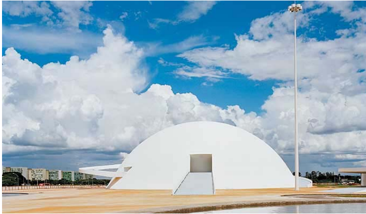
Museu Nacional – Esplanada dos Ministérios